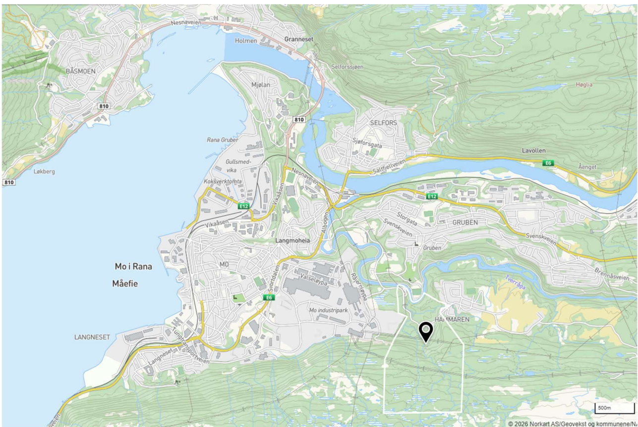
Figur 1: Planområdets beliggenhet er markert med svart dråpe, plangrense er markert med hvit linje. (kommunekart.com)

Tiltak som en ønsker å planlegge for i området er beskrevet og illustrert nærmere i planprogrammet. Planprogrammet beskriver problemstillinger, kunnskapsgrunnlag, metodikk som skal brukes i konsekvensutredningen, planprosess, medvirkning og framdrift. Det skal utarbeides konsekvensutredning for følgende tema: naturmangfold, vannmiljø, landskap, friluftsliv og klimagassutslipp. Øvrige relevante tema omtales i planbeskrivelsen og utredes i ROS-analyse.