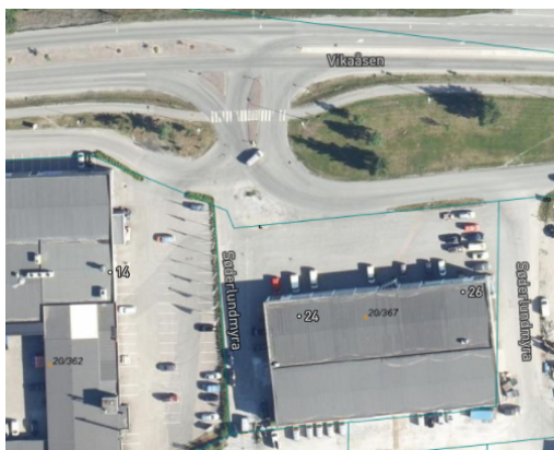
Figur 3: Krysset Vikaåsen–Søderlundmyra.

Planforslaget legger ikke til rette for adkomst til virksomhetene for myke trafikanter fra Vikaåsen/Søderlundmyra. Nærmeste busstopp er lokalisert langs Vikaåsen, og kollektivreisende som skal til planområdet vil bevege seg fra nord. Det er ikke fortau langs Søderlundmyra, og kryss-/adkomstområdet fra Vikaåsen og inn Søderlundmyra, er i dag utflytende og med mange konfliktpunkt for myke trafikanter. Vi kan ikke forvente at myke trafikanter, og særskilt barn og unge, skal kunne forstå kjøremønstret i området.