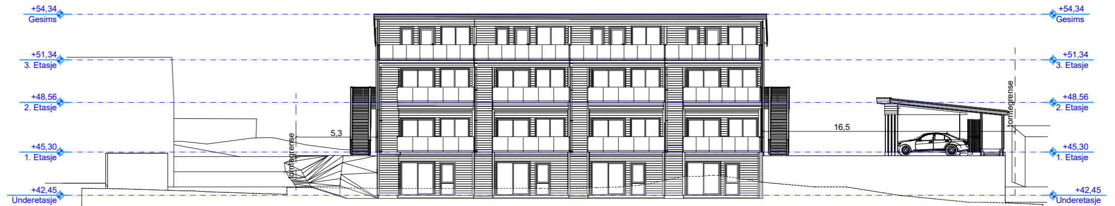
1:250 Terrengsnitt D (fades sør)