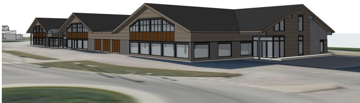
Figur 5 Illustrasjon av forretningsbygget sett fra rundkjøringa på Nesnaveien

I hovedtrekk vil planforslaget videreføre gjeldende plan, og eksisterende bygning skal gjenbrukes til formål i tråd med gjeldende plan. Planforslaget innebærer å tilrettelegge utomhusarealene bedre for å ivareta både trafiksikker adkomst, parkering og varelevering, blågrønne strukturer, naturreservatet, tilknytning av gang-/sykkelbru over til Mjølan, tursti langs Ranelva, parkering og småbåtutsett.