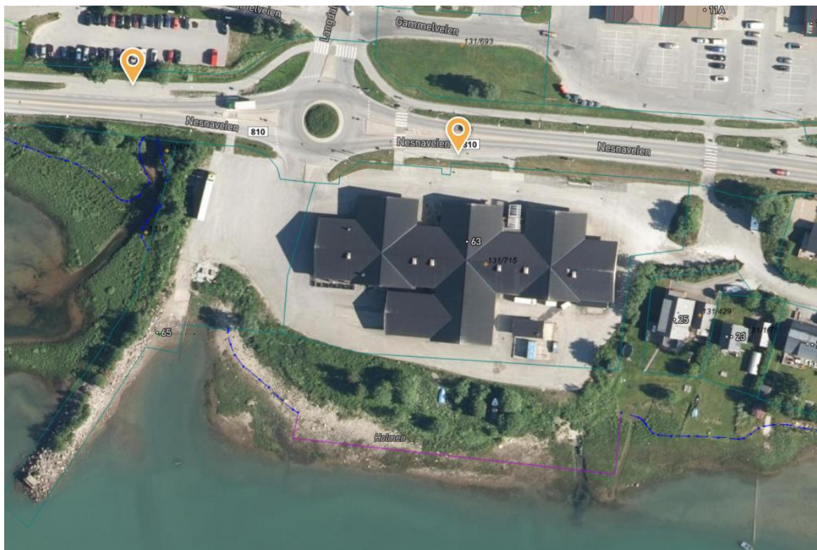
Figur 2 Ortofoto som viser bebyggelsen på Holmen vest. Markørene viser busstopp.

lokalene, mens de siste virksomhetene som har benyttet lokalene er møbelforretning, restaurant og solstudio. Lokalene står i dag tomme.