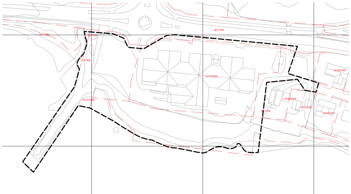
Figur 1 Planområdet

Planområdet ligger i Nesnaveien 63, og inkluderer de nærmeste omgivelsene på sørsiden av fylkesvei 810.