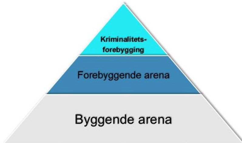
Nivåer i arbeidet knyttet til forebygging av kriminalitet

Forskning viser at rus- og kriminalitetsforebyggende arbeid må foregå på alle de tre nivåene. Det er likevel en oppfordring fra regjeringen om at SLT-modellen retter sitt fokus til det kriminalitetsforebyggende nivået. Det er her vi ofte finner de mest sårbare målgruppene med stor risiko for sosial utstøting og marginalisering.