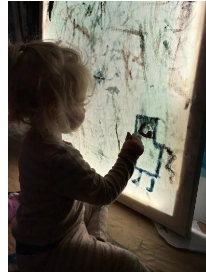
Vi bruker forskjellige teknikker når vi arbeider, vi leker og lærer av hverandre.