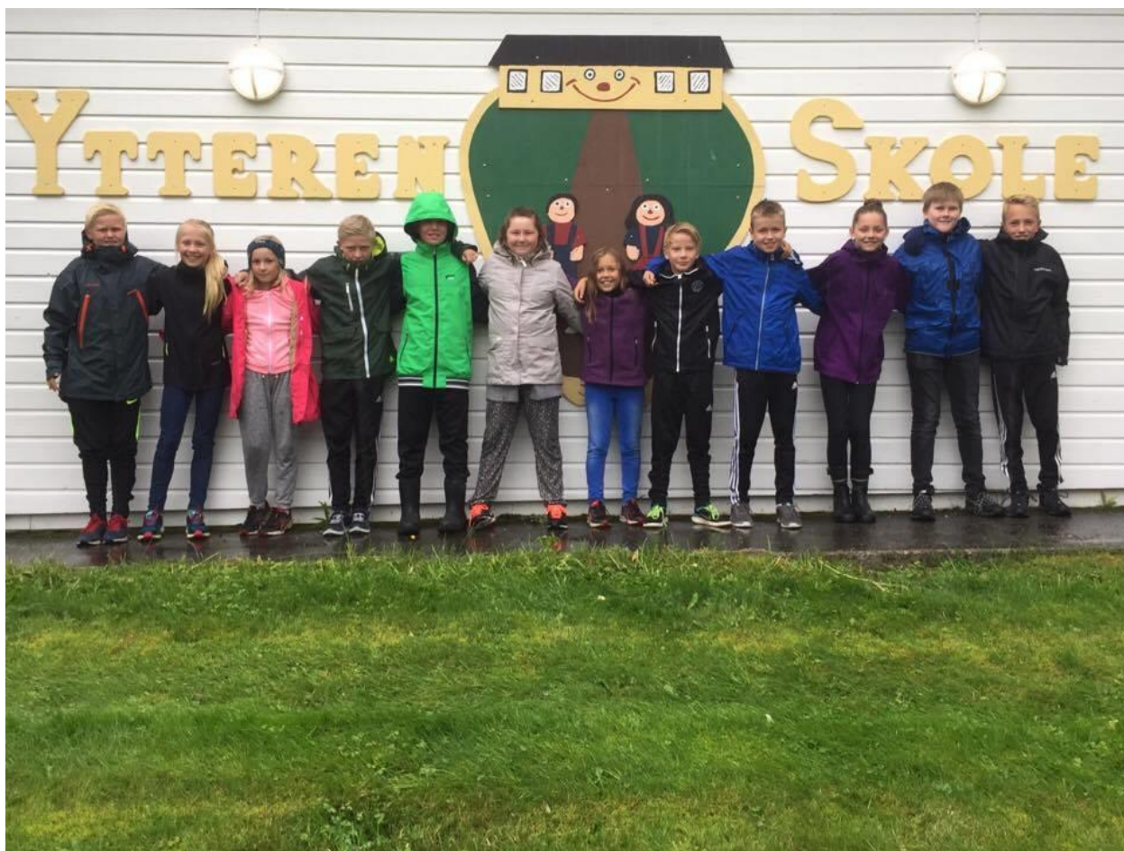
Elevrådet ved Ytteren skole 2016/2017