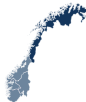
Fyllingsgrad (%) NO4, 2026