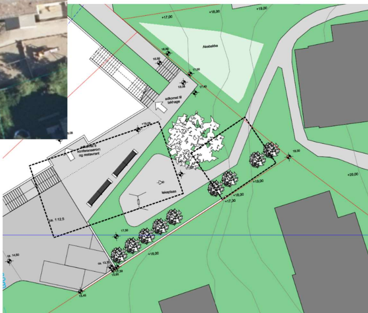
Figur 1 Utsnitt av utomhusplan. Dagens bebyggelse vist med stiplet sort strek