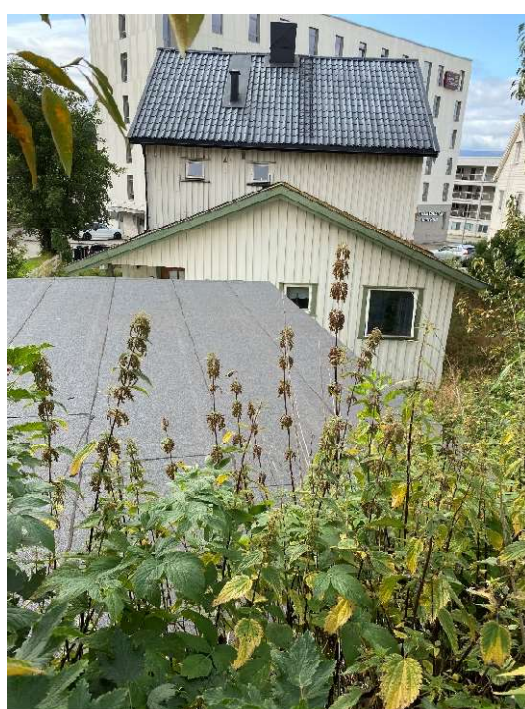
Figur 4 Garasje i Th v Westensgt 5 med takhøyde omtrent i terreng ved barnehagens gjerde

Barnehagen har problemer med sterke vindkast i bestemte situasjoner og det er viktig at dette ikke forverres.