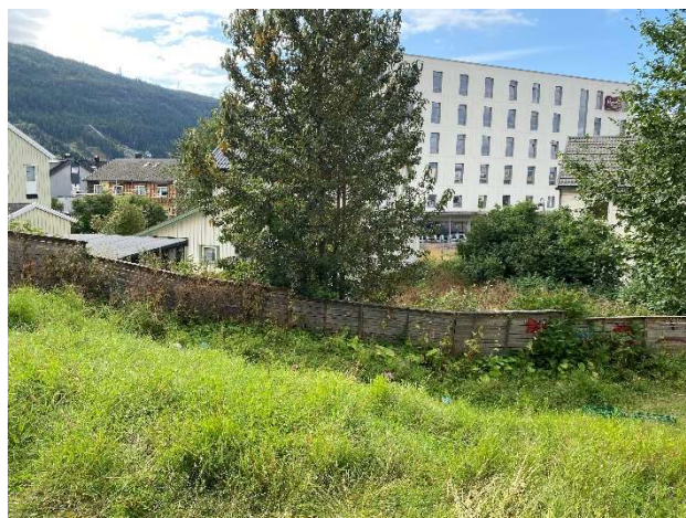
Figur 3 Akebakke og gjerde i grensa mot Thomas von Westens gate 3 og 5