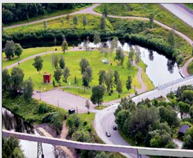
Revelneset er et flott utgangspunkt for turer i Klokkehagen Elvepark.

Ved bruk av elveparken gir friluftsløven deg både rettigheter og plikter. Husk at du skal forlate parken slik du finner den. Ta med søppel hjem.