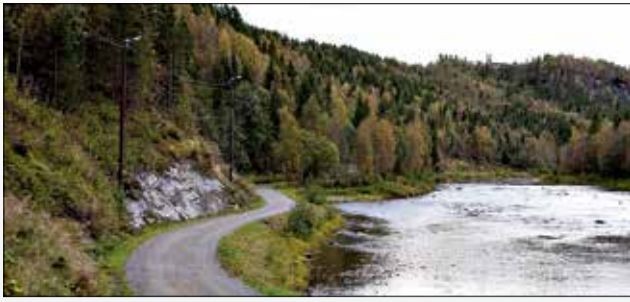
I en strekning av 6-7 km har Rana kommune bygd en turvei langs Revelåga. Turveien er tørr og kan brukes av mennesker med ulikt funksjonsnivå. Det er satt opp lys langs hele veien.