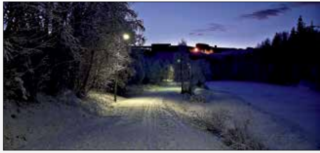
Om vinteren kjører Mo i Rana Bydrift opp skiløyper langs turveiene i Klokkehagen Elvepark.

Årestua er et fint turmål. I Årestua kan det grilles og kokes kaffe. Det er sitteplasser til 20 - 30 personer. Utenfor Årestua er det bord og benker til 50 personer. Ønsker du å leie Årestua eller kanoer – kontakt Rana kommunes Servicetorg på tlf. 75 14 51 80.