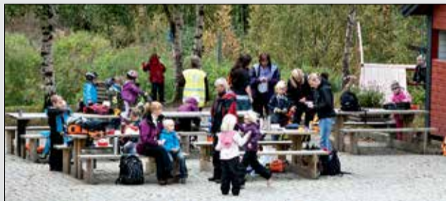
Klokkehagen Elvepark er mye brukt av barnehager, skoler og frivillige organisasjoner.

I Klokkehagen Elvepark har du en rekke turmuligheter. Det er gåavstand fra Mo sentrum til parken. Hovedinnfallsportene er Revelneset og ved selve Klokkehagen. Her er det etablert områder for gratis parkering. På kartet på baksiden finner du andre startmuligheter. Bruk Elveparken hele året til å være fysisk aktiv minst 30 minutter hver dag. Vinterstid kjører Mo i Rana Bydrift skiløype langs løypenettet. Skiløypa kan også benyttes til turer til fots. De gående må da gå utenom skisporet. I Klokkehagen Elvepark er det to lyssatte skileksområder. Englibakkens skileksområde ved Årestua og skileiks-anlegget ved Klokkehagenhuset.